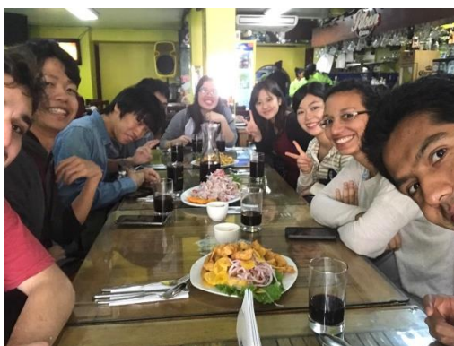
ラモリーナの学生との食事

次に、ラモリーナ大学の見学では、まず敷地の広さに驚いた。八つの学部から構成されていて校内にはボタニカルガーデンや広い圃場、水耕栽培施設、いくつもの研究室があった。アルパカや牛、馬などの動物も飼育していた。ペルーの農業、土壌、作物、トウガラシについての講義を受けたり、学生同士で自国についての発表を行ったり料理を振る舞ったりした。日本から用意して行った書道と折り紙も喜んでもらえて嬉しかった。ラモリーナの学生たちと沢山交流ができて楽しく、充実した時間だった。しかし、講義や発表の際に日本の人口や面積、農業の現状や先端の農業技術について聞かれたが、私には答えられないものがあつた。自国の現状や農業についてもっと知る必要があると反省し、これをきっかけに日本の事をしっかり勉強し直そうと思った。