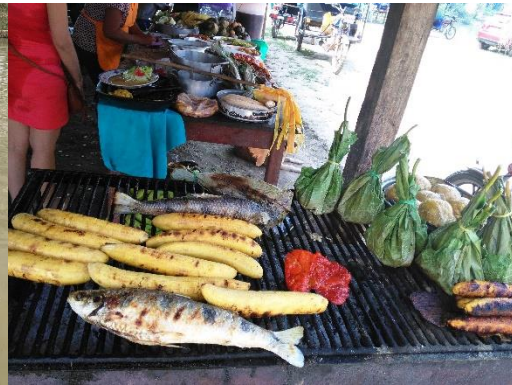
アマゾン特有の食事