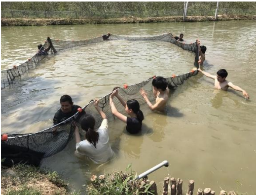
ピラルクの養殖池