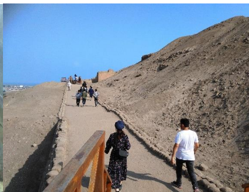
パチャカマック遺跡