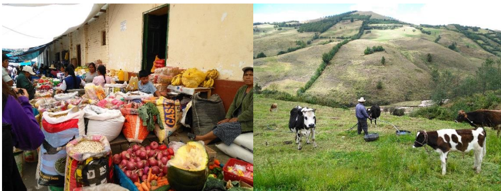
カハマルカのマーケット

その後カハマルカではマーケットや品種改良の国立研究所の見学、温泉や高山地帯の農村へ行った。週に一度開かれると聞いたマーケットには果物や野菜、肉などの食料品やヒヨコ、農機具や衣類、日用品が売られていて、マーケットは地域の人々にとってとても大切なものであることが分かった。国立研究所ではクイとトウモロコシの品種改良を行っていた。クイはインカ品種、チョタニタ品種があり、チョタニタ種は気温差などに耐える力があり、適合性に強いと知った。クイは品種ごとや離乳のために分けられていて、餌は濃厚飼料と牧草だった。子供は三週間経ったら離乳して三カ月したら濃厚飼料をあげるらしい。地域の温泉は個室制で時間が決められており、日本との違いが感じられて面白かった。そして、カハマルカの最後は標高 4000 メートルに近い非常に高い地点まで行った。その高山地帯でお世話になった方の家では持続可能な農業をしていた。高山地帯で栽培できるものは限られるが、土は非常に優れていてトウモロコシやキヌア、小麦、大麦、エンドウ豆などが栽培されていた。家は粘土によって作られたもので、伝統的な生活をしているのが印象的だった。広大な土地があるが、そこで生活をしている人は少ないため、街の住民で Ronda と呼ばれる団体を作って街のパトロールを定期的に行い、農作物や家畜の盗みを防止する仕組みを作っていた。